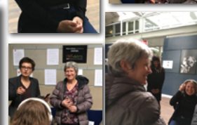
Team building sensoriel ... à la découverte de vos sens...